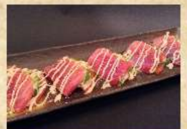
マグロとアボカドのカルパッチョ