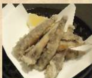
めひかりの唐揚げ