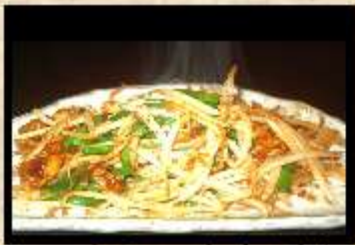
しゃきしゃきもやし