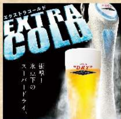
スーパードライエクストラ ご一緒にどうぞ