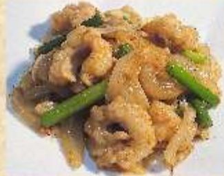
牛ホルモンとニンニクの芽