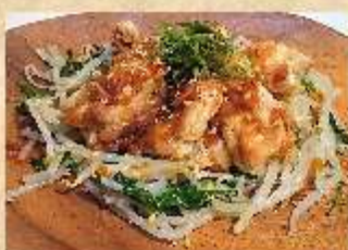
油淋鶏 (ゆーりんちー)

ポテトフライ めひかりの唐揚げ タコの唐揚げ 揚げだし豆腐 ピリ辛手羽先 とり唐揚げ ナンコツ唐揚げ カマンベールフライ 油淋鶏