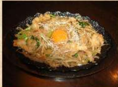
ホルモン焼きそば