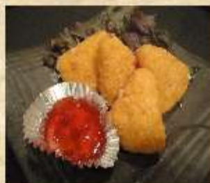
カマンベールフライ

350円 350円 380円 390円 390円 400円 400円 400円 550円